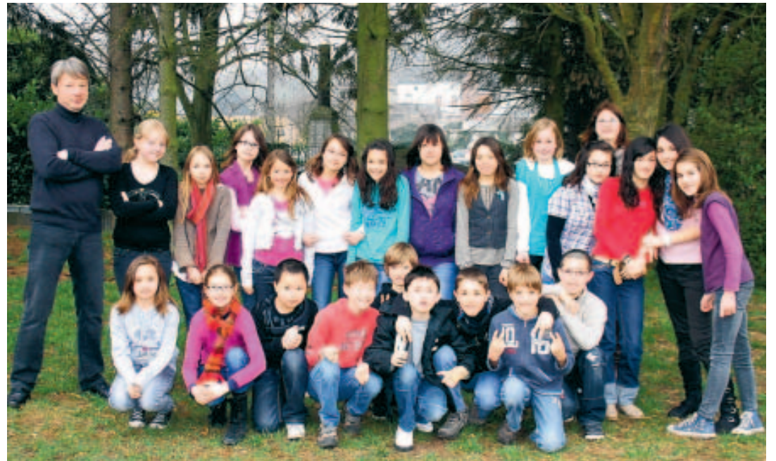
La classe de Monsieur Vincent a longtemps débattu sur les catastrophes actuelles au Japon. ■ L.D.W.